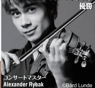
コンサートマスター Alexander Rybak